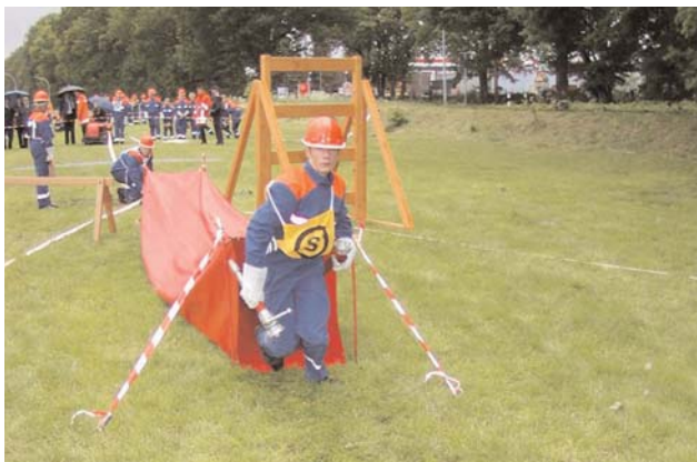
Der Schlauchtruppmann der Jugendfeuerwehr Iselersheim hat sein Hindernis, den Tunnel, fehlerfrei überwunden.

Im A-Teil wurde ein Löschgriff mit Wasserentnahme aus einem Unterflurhydranten durchgeführt. In der Wettbewerbsbahn mussten zusätzlich verschiedene Hindernisse den Sicherheitsbestimmungen entsprechend überwunden werden. Am Ziel waren dann vier vorgegebene Knoten fehlerfrei zu legen. Im B-Teil, einem Staffellauf, war neben Schnelligkeit auch Geschicklichkeit beim Schlauchrollen und Leinenbeutelzielwerfen erforderlich.