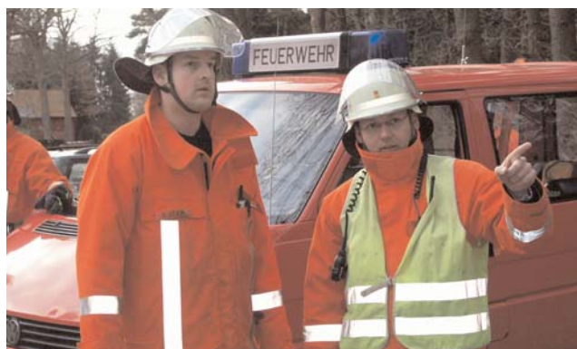
Nach dem Eintreffen bekommen die einzelnen Fahrzeugführer ihre Anweisungen von der Einsatzleitung

Insgesamt nahmen an dieser Übung rund 70 Kameraden aus den Ortsfeuerwehren Heeslingen, Steddorf, Wiersdorf, Weertzen und Wense teil. Es kam dabei aber auch der vom Landkreis bereitgestellte Gerätewagen Atemschutz zum Einsatz, dieser sollte die von den Männern geleerten Atemluftflaschen wieder befüllen, was bei der Anzahl der zum Einsatz gekommenen Geräte viel Zeit in Anspruch nahm. Bei der anschließenden Einsatznachbesprechung gab es die einstimmige Meinung, dass Alles in Allem die Übung sehr gut verlief und dass auch weiterhin auf diesem Niveau und diesem Umfang geübt werden müsse, um die Zusammenarbeit der einzelnen Wehren und Kameraden zu fördern. Nachdem das Aufräumen erledigt war, fuhren die Brandschützer nach rund zweieinhalb Stunden wieder zu ihren Gerätehäusern zurück, um das Material für den nächsten Einsatz vorzubereiten.