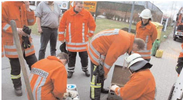
Provisorisches Abdichten der Leckstelle

einen Umweltschaden zu verhindern, denn in der unmittelbaren Nähe des Schadensortes verläuft ein kleiner Bach. Um der Ursache auf die Spur zu kommen musste ein Teil der Abdeckung des LKW entfernt werden. Der Wagen konnte seine Fahrt ohne Behinderung nach Bremen fortsetzen, allerdings musste nun ein Ersatzfahrzeug die restlichen Gelben Säcke und Tonnen leeren. Der Inhalt des defekten Fahrzeuges wird nun als Sondermüll entsorgt werden müssen, da Hydrauliköl eine weitaus höhere Gefahr für die Umwelt darstellt als zum Beispiel Motorenöl.