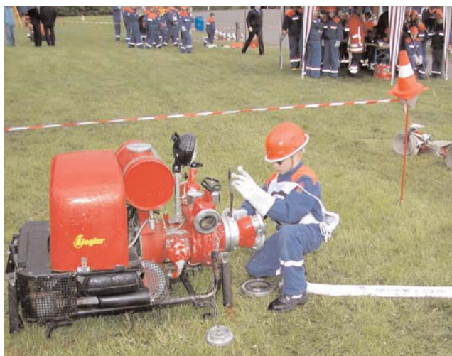
Alle Gruppenmitglieder, wie hier der Maschinist der Jugendfeuerwehr Basdahl, sind bemüht, fehlerfrei ihre Aufgaben zu erfüllen.