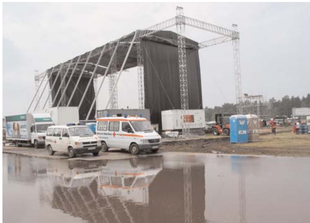
Viel Wasser am 26. Juni 2006 beim Hurrican Festival

Schichtwechsel zog eine riesige Gewitterfront auf mit der man eigentlich laut dem Wetterdienst gar nicht gerechnet hatte. Leider wurde das Festival unterbrochen, die Band „Mouse“ konnte aus Sicherheitsgründen nicht mehr auftreten. Es regnete und donnerte wie verrückt, Blitze zogen hell erleuchtet zu Boden. Mehre Blitze schlugen unmittelbar neben dem Veranstaltungsgelände ein. Ein teil der Feuerwehr, die auf dem Hurricane stationiert war, wurde zu einem Großbrand in Scheeßel gerufen, dort brannte das Heimathaus. Der starke Regen sorgte dafür das die Rettungswagen teilweise bis zum Schweller unter Wasser standen. Der HVP ist total im Wasser versunken und ein Teil der Küchen und Verpflegungszelte stürzten zusammen. Zum Glück kam bei diesem gewaltigen Unwetter kein Mensch zu Schaden. Nur nass wurden sehr viele Gäste und ver-