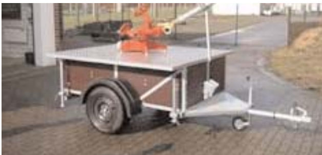
In 100 Arbeitsstunden bauten sechs Kameraden der Bremervörder Schwerpunktfeuerwehr in ihrer Freizeit diesen Wasserwerfer- und Schlauchanhänger

die in Buchten gelegt sind und während der Fahrt verlegt werden können. Die Schubladen können zum Auffüllen fast ganz herausgezogen werden und vier Kameraden benötigen dazu ungefähr eine halbe Stunde. Als Zusatzbeladung sind noch ein Standrohr und ein Unterflurhydrantenschlüssel sowie ein Überflurhydrantenschlüssel auf dem neuen Wasserwerfer- und Schlauchanhänger aufgebaut worden.