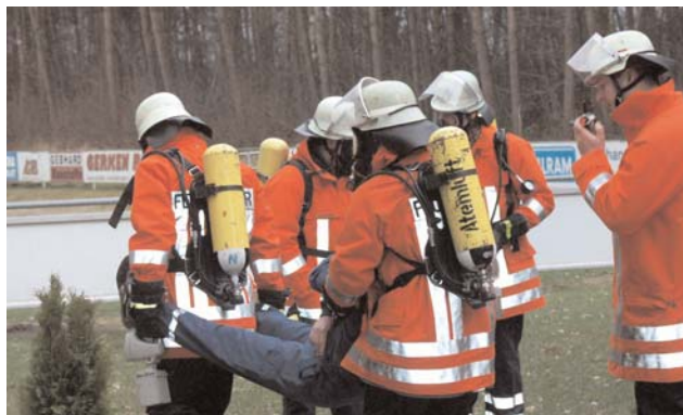
Ein Überlebender wird gerettet