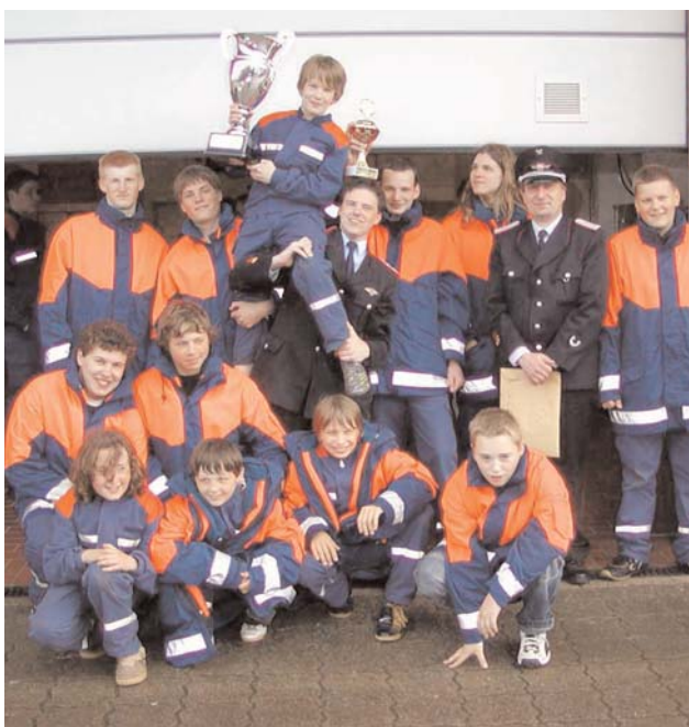
Die Mitglieder der Jugendfeuerwehr Barchel und ihre Betreuer freuen sich über den Sieg beim Kreisentscheid und den Wanderpokal, den sie jetzt behalten dürfen.