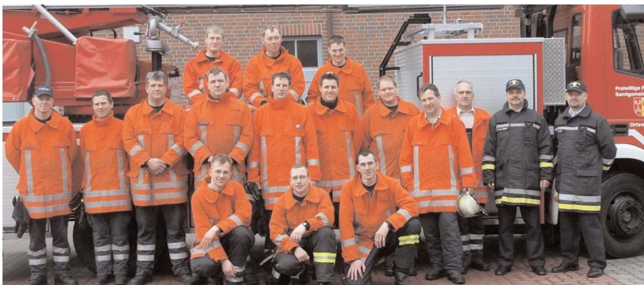
Die Kameraden vor der Drehleiter

Am Nachmittag wurde dann der praktische Teil auf den Schulhof der Schule am Kloostergang geübt. Dort ergaben sich einige neue und bis dahin total unbekannte Einsatztaktiken zum retten von Personen aus Höhen, das richtige Einweisen des Fahrers und somit den Standort eines solchen Fahrzeuges. Am Ende der Veranstaltung waren sich die Brandschützer einig, diese Veranstaltung zeigt, das es neben Lehrmeinungen noch weitaus mehr gibt um einen effizienteren Einsatz mit einem noch besseren Ergebnis durchzuführen.