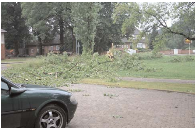
Der Sturm im Juni stürzte diese Pappel direkt vor das parkende Auto.

Nachbarhof und landete genau vor einem geparkten PKW der nicht beschädigt wurde aber die gesamte Hofeinfahrt blockierte. Gegen 23:30 Uhr waren alle Einsätze abgearbeitet und die Feuerwehrleute konnten ihre wohl verdiente Nachtruhe antreten.