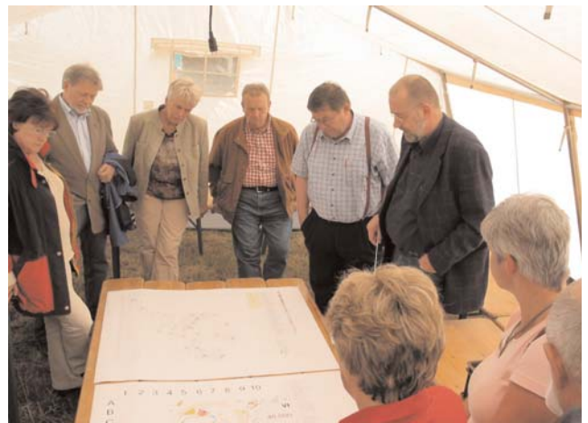
Lagebesprechung mit Kreisfeuerwehrausschuß

Kurz vor Schluss der Veranstaltung ging es aber noch einmal richtig Rund und alle Einsatzkräfte wurden in Alarmbereitschaft gesetzt. Grade zum