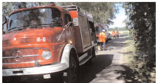
Flächenbrand in Bothel schnell unter Kontrolle

Bothel (pb). Die Botheler Feuerwehr musste nach dem Großbrand im Horstweg am Sonntag, den 16. Juli 2006 wieder zu einem Brandeinsatz ausrücken. Zum Glück hatten aufmerksame Fahrradfahrer das Feuer rechtzeitig erkannt und die Feuerwehr verständigt. Das kleine Feuer brannte in einer Grabenböschung auf der Straße zwischen Bothel und Bretel. Der Brandherd konnte schnell gelöscht werden, das dahinter liegende Getreidefeld wurde nicht betroffen. Wie der Brand entstehen konnte wurde nicht geklärt aber bei der momentanen Trockenheit hätte eine Zigarette genügt um ein Feuer in gang zu setzen.