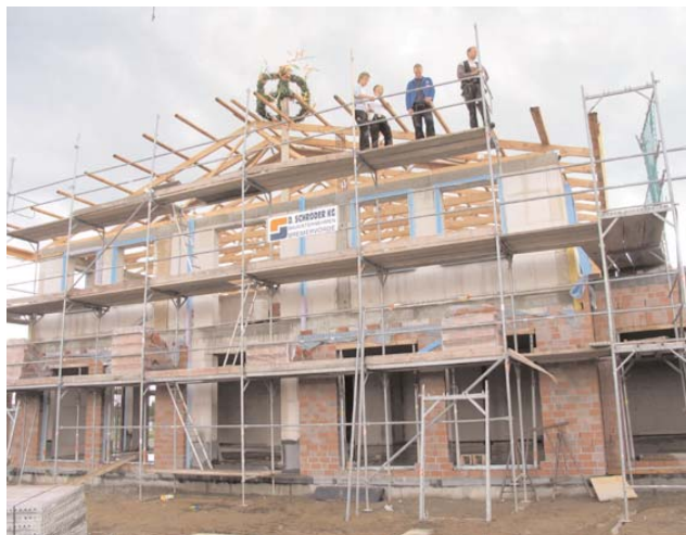
Eine Vielzahl von Ehrengästen war anlässlich der Richtfeier nach Bremervörde gekommen, um der Richtfeier für das 1,6 Millionen teure Feuerwehrhaus bei zu wohnen.