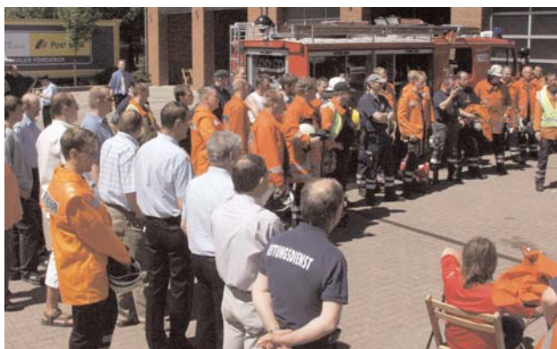
Reges Interesse bestand am Seminar „Patientengerechte Unfallrettung“