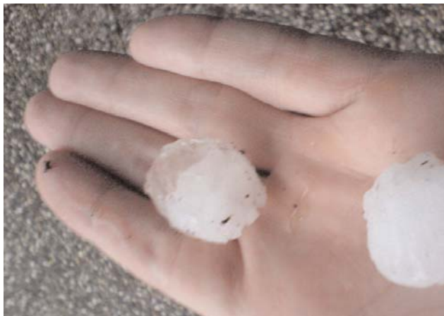
Auf den Fotos zu sehen, dicke Hagelkörner, welche in Zeven für Verwüstung sorgten.

Genauso schnell wie es kam verzog sich das Unwetter wieder und hinterließ eine Spur der Verwüstung in großen Teilen des Landkreises.