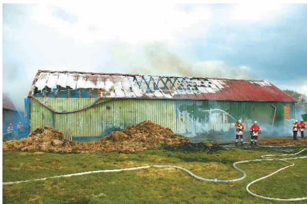
Wegen der großen Hitzentwicklung in der Halle und Einsturzgefahr war ein Innenangriff nicht möglich.

Text: Bernd Gerken