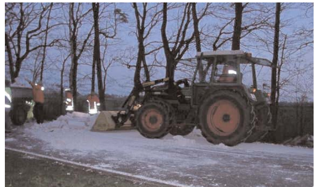
Zum Aufräumen wurden Traktoren von Feuerwehrkameraden herangezogen.