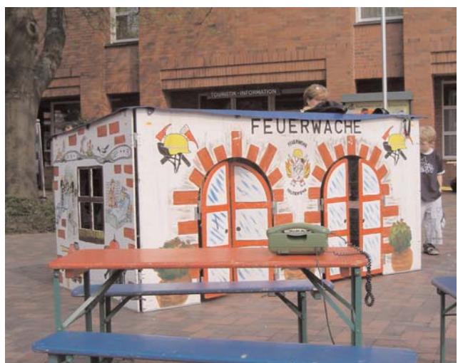
In der kleinen „Feuerwache“ wurde vergeblich die Rutschstange gesucht.