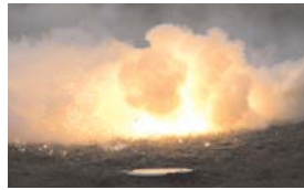
Wenn Aluminium brennt