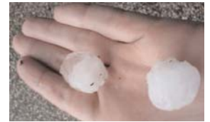
Schwere Unwetterschäden im Landkreis Rotenburg