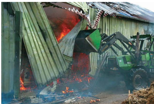
Zur Brandbekämpfung wurde die Blechverkleidung mit einem Trecker geöffnet

Es brannte Stroh in einer Halle, welches als Isoliermaterial verwendet wurde. Mit dem Stroh waren mehrere Fermentertanks im Gesamtvolumen von 350 cbm umhüllt. Die Tanks standen sehr eng beieinander, so dass der Brandherd sehr schwer und teilweise gar nicht zu erreichen war. Zur Brandbekämpfung wurde massiv Löschwasser aus einem in der Nähe befindlichen Unterflurhydranten entnom-