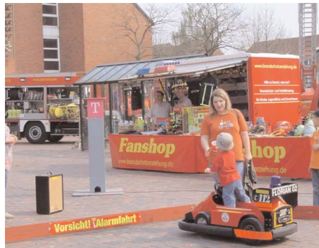
Viel Spaß hatten die Kleinen mit den Mini-Feuerwehrfahrzeugen, die sie selber fahren durften.

Bei kleineren Einsatzübungen zeigte der Nachwuchs, was sie schon alles in den vergangenen Jahren gelernt hatten. Beim Kinderschminken und verschiedenen Spielen hatten die Kleinsten ihren Spaß und beim Malwettbewerb lockten mehrere Preise. Bleibt zu hoffen, das sich viele Jugendliche beim „Tag der Stadtjugendfeuerwehr“ mit dem Bazillus Jugendfeuerwehr haben anstecken lassen, damit die aktiven Gruppen und Jugendfeuerwehren auch in Zukunft keine Nachwuchsschwierigkeiten haben.