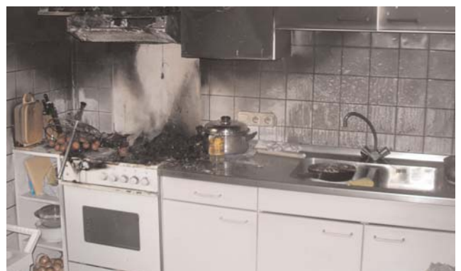
Die völlig vom Qualm und enormer Hitze zerstörte Küche