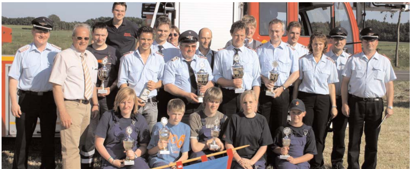
Die siegreichen Wettkampfgruppen des Stadtfeuerwehrfestes in Nieder Ochtenhausen.

Peters und seine Helfer hatten einen hervorragenden Wettkampfpplatz für die 5 LF- und neun TS-Gruppen sowie die 9 Jugendgruppen hergerichtet.