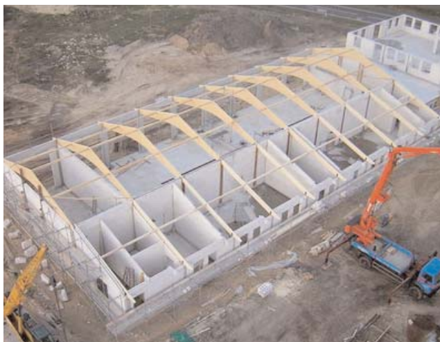
Blick von der Drehleiter auf das neue Bremervörde Feuerwehrhaus. Ganz rechts entsteht derzeit das Verwaltungsgebäude. Im Vordergrund ist die Fahrzeughalle zu erkennen.