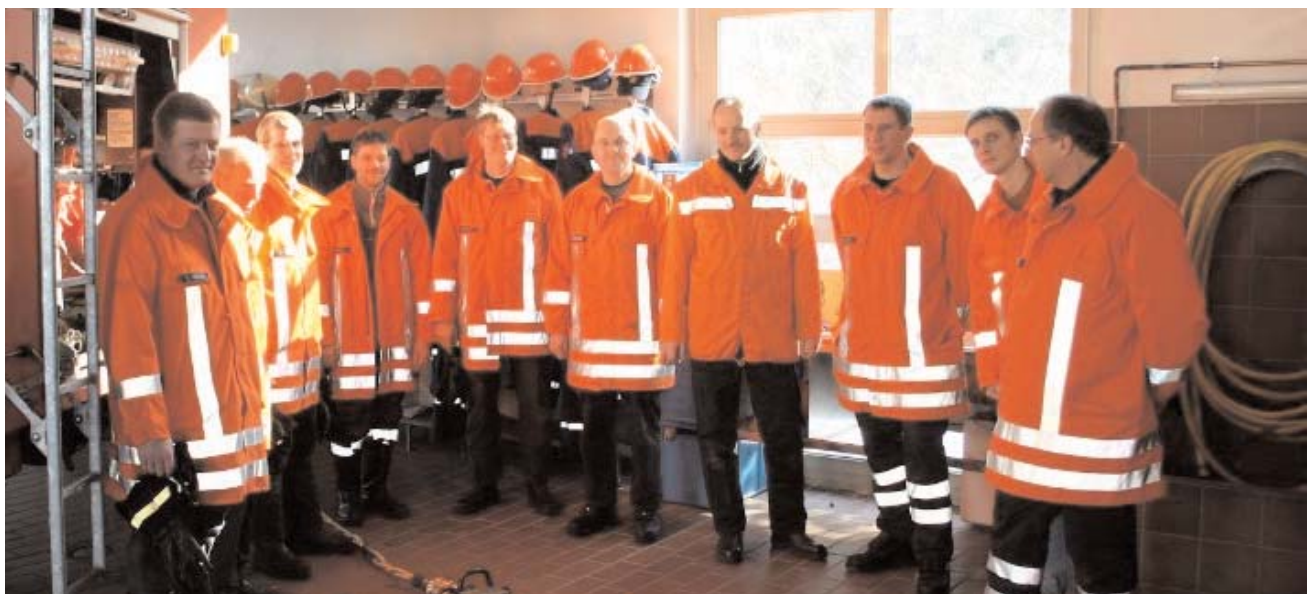
Die Kameraden der Feuerwehren Hemsbünde & Hastedt bilden sich gemeinsam aus.

gehen lassen können, da Termine einzuhalten sind. Da sich die Einsätze nicht auf die Abend und Morgenstunden verschieben lassen, werden am Tage mehrere Feuerwehren gerufen um die anfallenden Einsätze abzuarbeiten. Umso wichtiger ist es daher, dass alle Feuerwehrleute sich in ihren Nachbargemeinden auskennen, besonders gut natürlich mit dem zur Verfügung stehendem Material auf den Einsatzfahrzeugen. Somit können die Feuerwehren auch in Zukunft in der Samtgemeinde Bothel retten, löschen, bergen und schützen um den Bürger eine perfekte Sicherheit zu bieten.