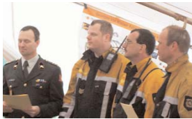
10-jähriges Jubiläum der Kasernenfeuerwehr Seedorf

Mitteilungsblatt der Feuerwehren des Landkreises Rotenburg (Wümme) Nr. 29 August 2006