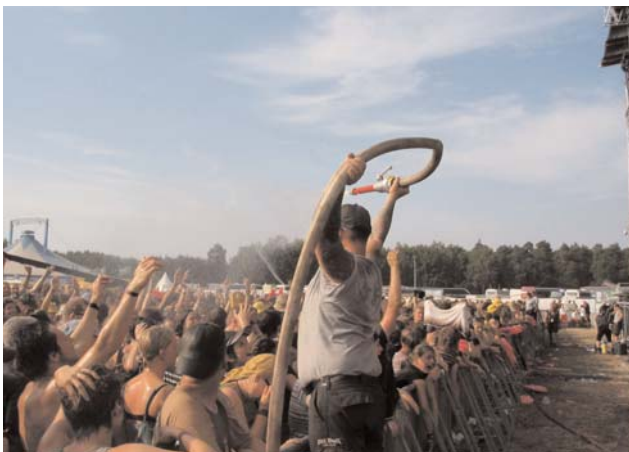
Wasserversorgung mit D-Rohr

Allgemein gesehen ist das diesjährige Hurricane Festival sehr friedlich abgelaufen, die Patienten Behandlungen sind zum letzten Jahr etwas gesunken. Auch wenn in diesem Jahr das „Hurricane“ seinem Namen alle Ehre machte, hatten alle ihren Spaß und die Freunde behalten, man freut sich auf das nächste Jahr.