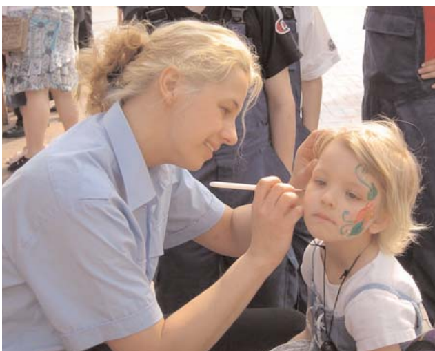
Besonders großer Andrang herrschte in der Kinderschminckecke.