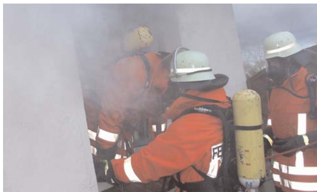
Ein Trupp geht in das verrauchte Gebäude vor, in dem noch Personen vermisst werden.

Als die ersten Fahrzeuge eintrafen wurden sofort erste Trupps zur Personensuche unter Atemschutz eingesetzt. In dem Gebäude wurden insgesamt fünf Personen vermisst, welche es schnellstmöglich zu retten galt. Nachdem die ersten Trupps in das Gebäude vorgegangen waren, wurde die Wasserversorgung vom Hydranten und der nahe gelegenen Oste herge-