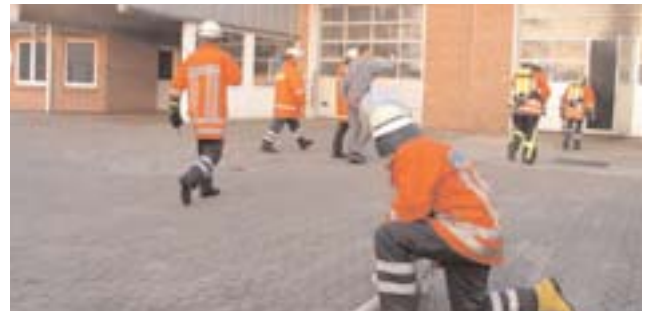
In dieser Kfz-Werkstatt in Bevern brach gegen 06.30 Uhr ein Feuer aus, das großen Schaden verursachte.

Unter schweren Atemschutz gingen die einzelnen Trupps in die Werkstatt, um den Brandort zu lokalisieren. Schnell stellte sich heraus, das ein Citroen C3, der am Vortag in die Werkstatt gebracht wurde, aus