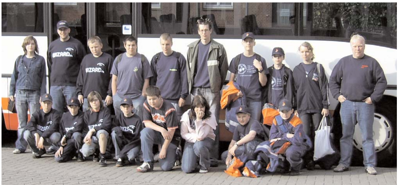
Das Bremervörder Busunternehmen Busreisen Stoss stellte den Reisebus kostenlos zur Verfügung

Wenn auch alle Mitglieder der Stadtjugendfeuerwehr am Ende strapazierte Füße hatten, es war ein sehr interessanter Ausflug. Hier wurde wieder einmal gezeigt, dass der Dienst in einer Jugendfeuerwehr viel mehr ist, als nur die Feuerwehrausbildung.