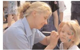
1.Tag der Stadtjugendfeuerwehr in Bremervörde