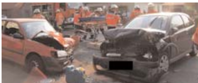
Mit überhöhter Geschwindigkeit verursachte der 24-jährige Kamerad aus Bevern auf der Fahrt zum Feuerwehrhaus einen schweren Verkehrsunfall.

Kurz nach 18:00 Uhr wurde die Ortsfeuerwehr Bevern alarmiert. An der Straße „Am Biberdamm“ brannten