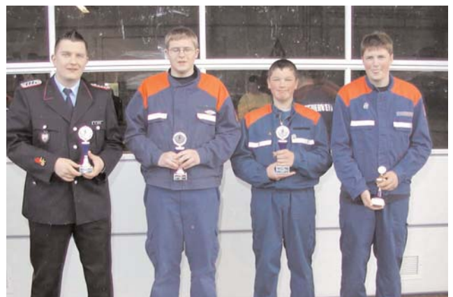
Die Vertreter der mit Pokalen ausgezeichneten Jugendfeuerwehren freuen sich über ihre guten Kegelergebnisse und nehmen die Auszeichnung für die höchste Pudelzahl mit einem lachenden Auge entgegen.