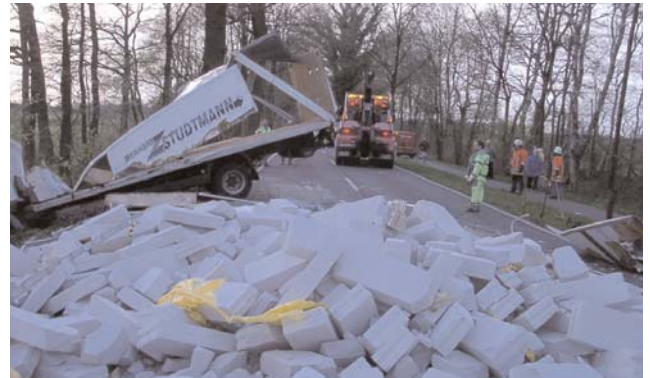
Die Ladung versperrte die Fahrbahnen der Bundesstraße

Die Bundesstraße 440 war vor Jahren einer der Unfallschwerpunkte im Landkreis Rotenburg. Seit dem Jahr 2000 ist dieser Abschnitt geschwindigkeitsbegrenzt, was einen deutlichen Rückgang der Unfallzahlen bewirkte und auch die Hilfeinsätze der Wittorfer Feuerwehr auf annähernd Null sinken ließ.