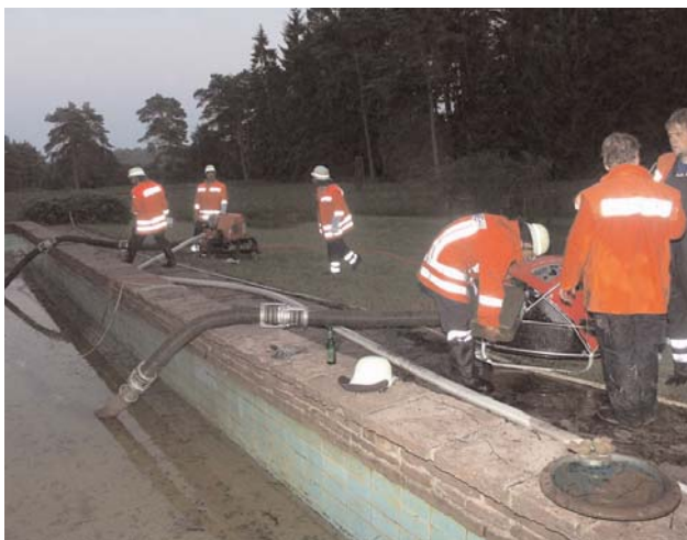
Swimmingpool als Wasserentnahmestelle

Gegen 23:00 Uhr verließen alle Feuerwehren die Einsatzstelle, nur die Feuerwehr Winkeldorf verblieb noch um ein eventuelles neu Aufflammen zu verhindern. Eine Brandursache steht bisher noch nicht fest, auch die Höhe des Sachschadens ist noch nicht abzusehen.