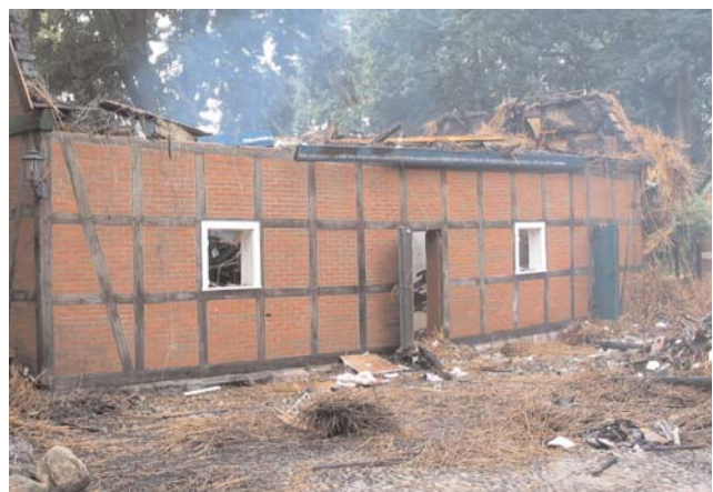
Nach dem Brand auf dem Meyerhof