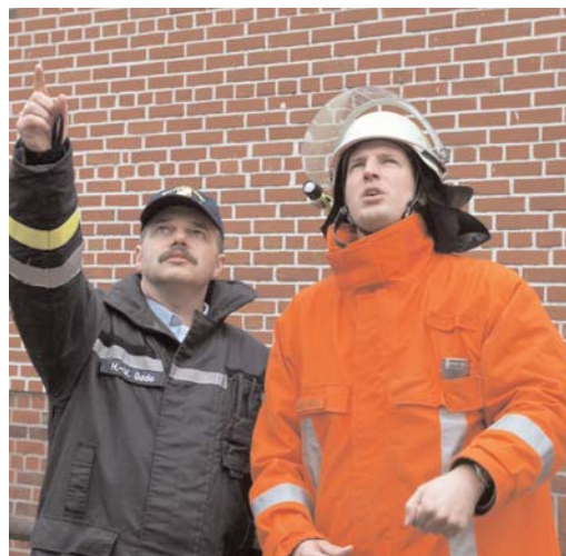
Einweisung eines Feuerwehrmannes auf das Objekt vom Dozenten

wozu das technische Rettungsfahrzeug der Feuerwehr genutzt werden kann.