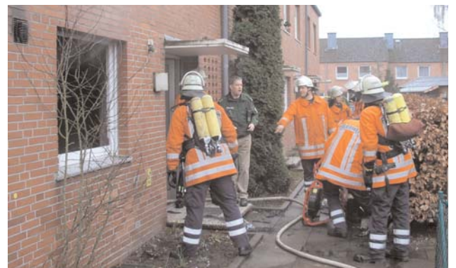
Trupps unter schwerem Atemschutz gehen durch den Haupteingang vor

Eine genaue Schadenssumme wurde bisher noch nicht bekannt. Glücklicherweise konnte der mitalarmierte Rettungsdienst unverrichteter Dinge wieder einrücken, alle Anwohner hatten sich unverletzt ins Freie gerettet.