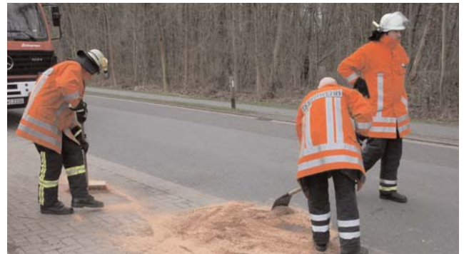
Die Schadenstelle wird weiträumig mit Ölbindemittel abgestreut

Zeven (fz). In den Mittagsstunden des 11. April 2006 befuhr ein Müllfahrzeug der Bremer Entsorgungsfirma Nehlsen den Zevener Sonnenkamp um die dort stehenden gelben Tonnen, in Höhe des Campingplatzes, zu leeren. Bei der Umschüttung der Container in das Fahrzeug bemerkte der Fahrer, dass unter dem Fahrzeug Hydrauliköl auslief. Im inneren Bereich der Müllpresse war ein Hydraulikschlauch geplatzt und setzte somit auch das gesamte System lahm. Sofort alarmierten die Mitarbeiter die Feuerwehr, die mit zwei Fahrzeugen ausrückte um das Öl abzustreuen und aufzunehmen um somit