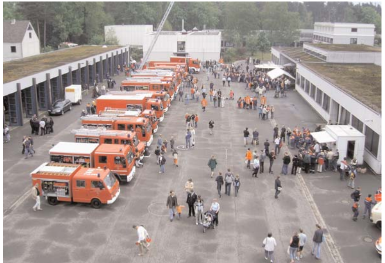
Viel zu Sehen gab es für die beim „Tag der offenen Tür“ in der Landesfeuerwehrscheule Celle.

Einer der Höhepunkte war aber die Löschvorführung. Hier wurden Holz, Benzin, Fett und Metall zum