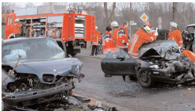
Die am Unfall beteiligten Fahrzeuge hatten nur noch Schrottwert

Die Fahrerin des Mazda-Cabrio war auf den Gegenfahrstreifen gefahren und kollidierte dort mit einem entgegenkommenden BMW-Kombi. Die nicht