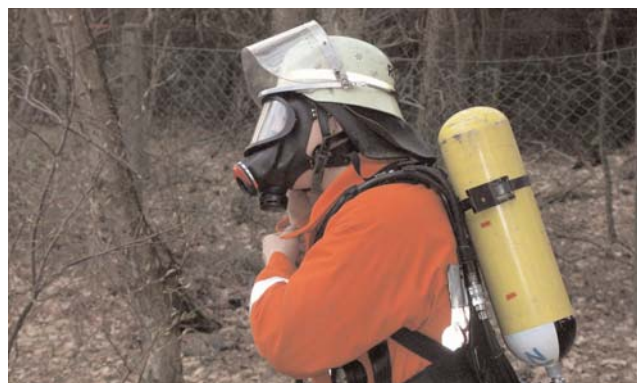
Die Trupps rüsten sich mit schwerem Atemschutz aus

Zusätzlich waren auch noch Propangas-Flaschen aus dem Gebäude zu sichern, da Explosionsgefahr bestand, wurden diese zum Kühlen ins Freie gebracht. Als ob dem aber noch nicht genug war, fing plötzlich noch der Kiosk, welcher sich auf dem Sportplatz befindet, Feuer. Dort hatten zwei Personen unvorsichtig mit