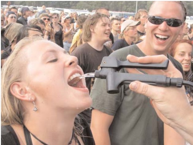
Erste Wasserversorgung der Zuschauer

Scheeßel (pb). Es war mal wieder soweit, das Hurricane startete am Freitag, den 23. Juni 2006 mit seinem interessanten Programm. Der Veranstalter erwartete zu diesem besonderen Event über 50.000 Besucher die sich an drei Bühnen mit Rockmusik vergnügen konnten. Eine der bekanntesten Bands mit dem Namen „Fettes Brot“ trat gleich am ersten Tag auf und stimmte die Besucher in beste Partylaune. Die riesigen Boxen sorgten für einen megamäßigen Bass der nicht nur auf dem Eichenring zu hören war. In den Nachbargemeinden konnte man bei dem schönen Wetter den Gesang der Künstler teilweise auch mithören. Ebenfalls für viel Stimmung sorgten die Stars von „Wir sind Helden“.