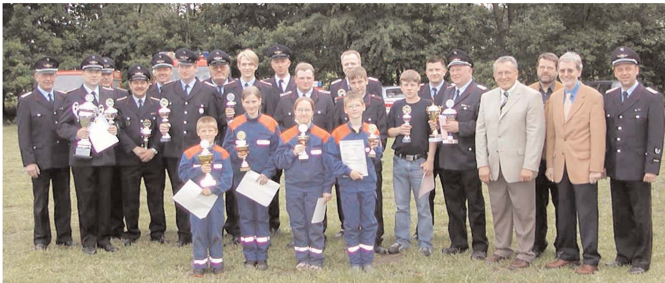
Für ihre Leistungen wurden die teilnehmenden Gruppen mit Pokalen ausgezeichnet.