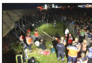
Bilanz des Hurricane-Festivals