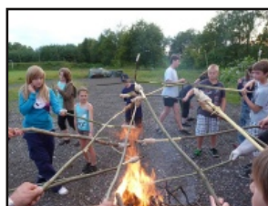
Zeltlager der Jugendfeuerwehr in Hemsbünde