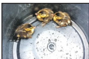
Entenrettung in Bremervörde