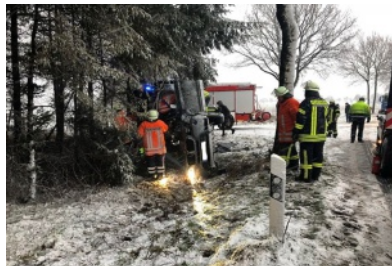
Verkehrsunfall auf K139 bei Ippensen-Ahrenswohldede