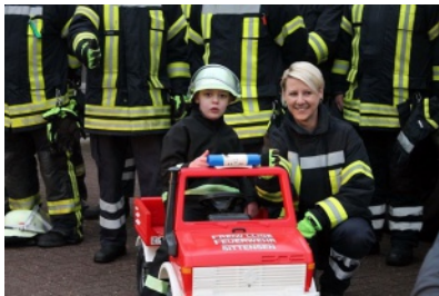
Wunschbox-Aktion der Rotenburger Rundschau