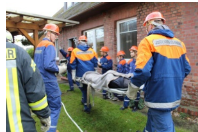
Großübung der Jugendfeuerwehren der SG Geestequelle